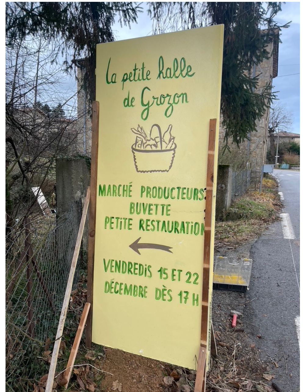
Images de la première expérience de « magasin participatif » 15/12/2023