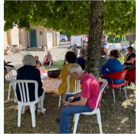
La « lecture sous l'arbre »