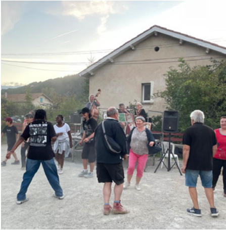
Les danseurs apprennent les pas de quelques danses traditionnelles

Accueil des habitants, - et particulièrement les nouveaux habitants- ainsi que les vacanciers, petit marché, avec quelques producteurs locaux, stand et dédicaces réservé aux écrivains liés à la commune, et lecture de quelques extraits animée par l'association. « Lire et faire lire », puis, en fin de journée, temps de musique et de danse, merveilleusement animé par le groupe « Balbizard »